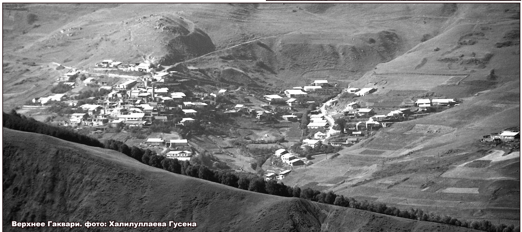
Верхнее Гаквари.