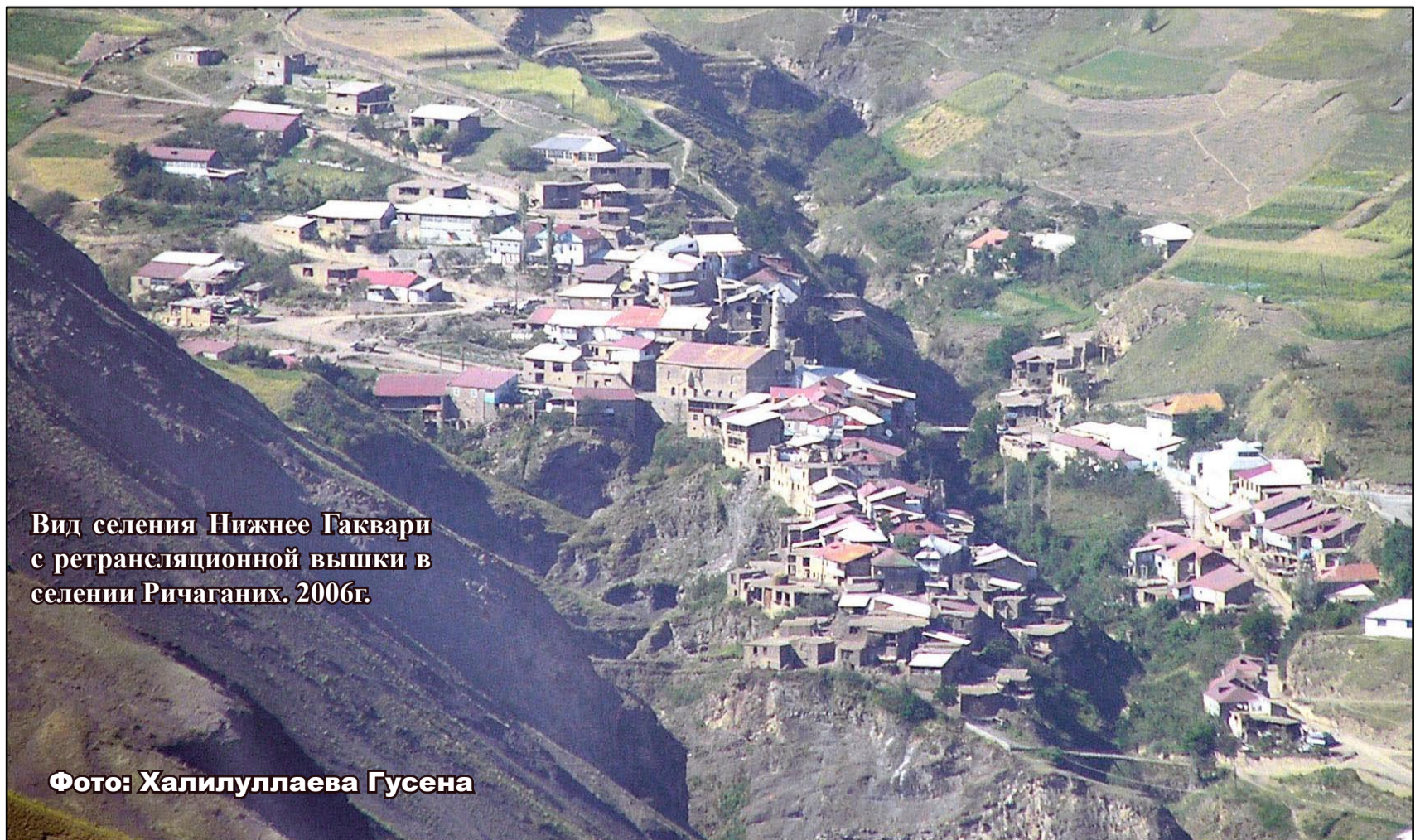
Вид селения Нижнее Гаквари с ретрансляционной вышки в селении Ричаганих. 2006г.