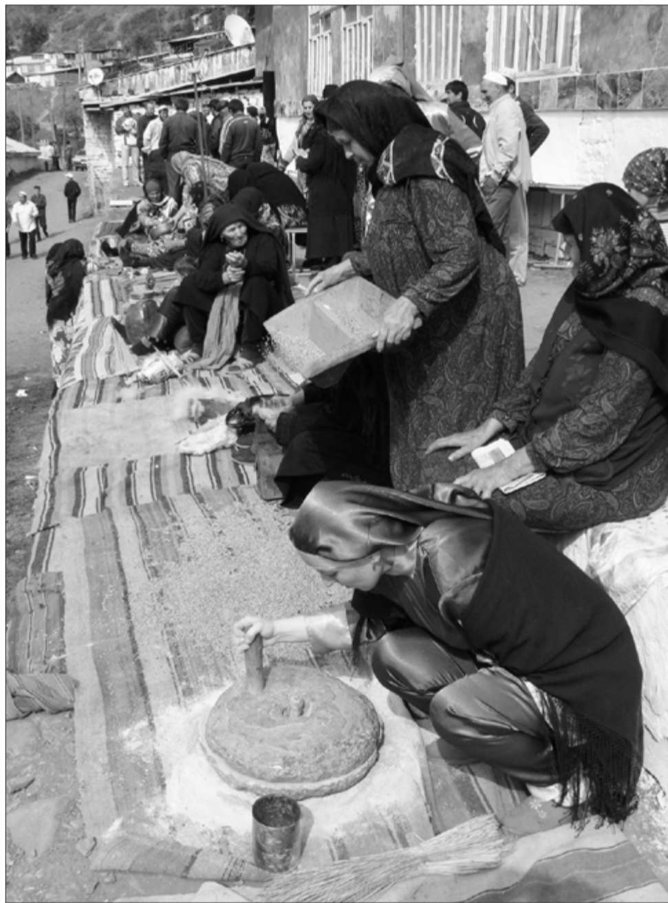
Демонстрация местными женщинами старинного рукоделия и костюмов, в рамках научной конференции "Народы Андийского Койсу в Кавказской войне XIXв. " - 10.10.2009г.