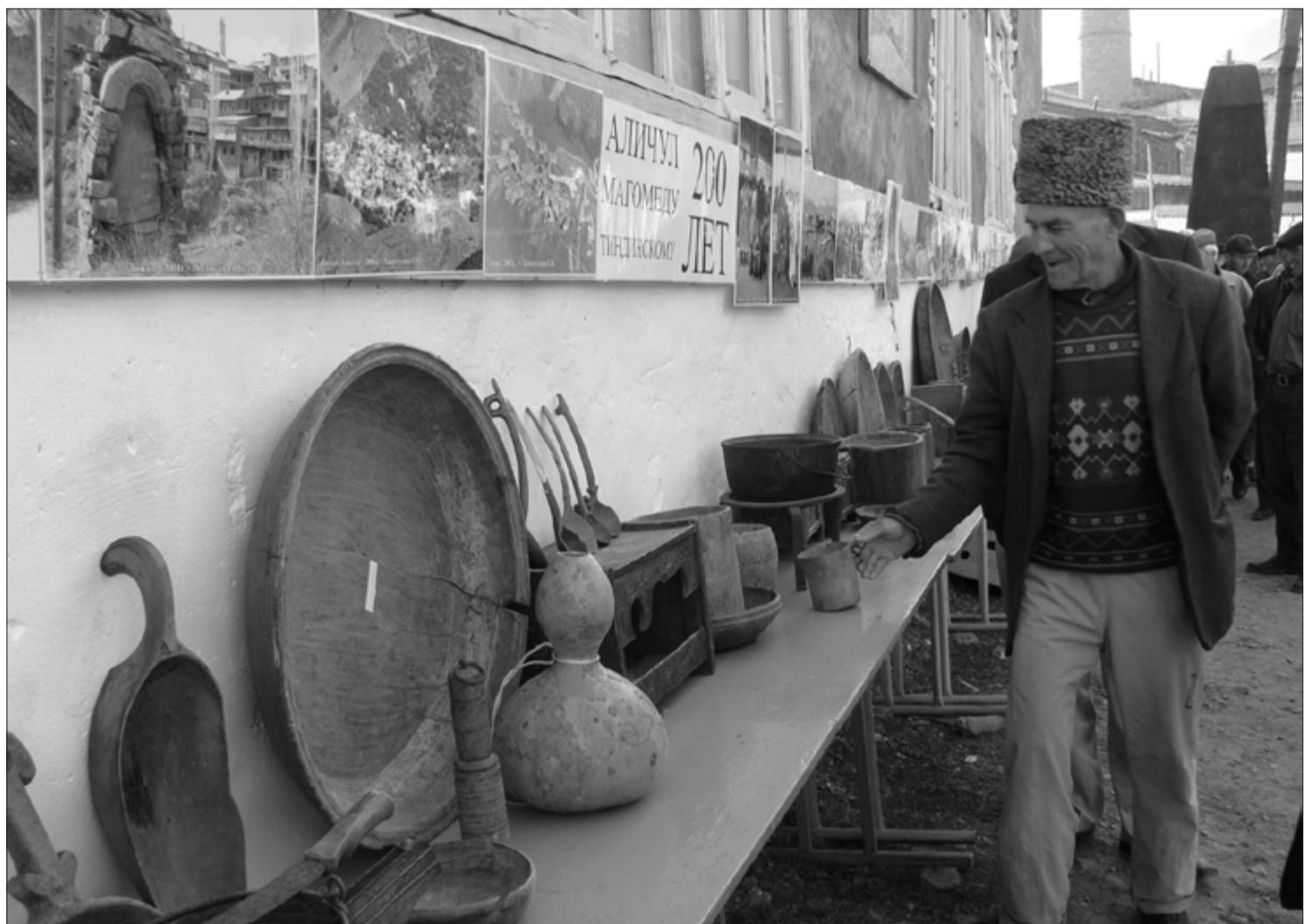
Фотовыставка и музейная экспозиция в рамках научной конференции "Народы Андийского Койсу в Кавказской войне XIXв." - 10.10.2009г.